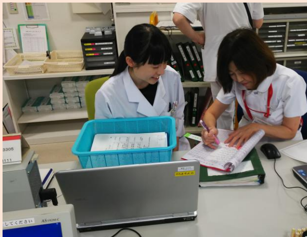
↑ 写真③ 看護師からの相談対応